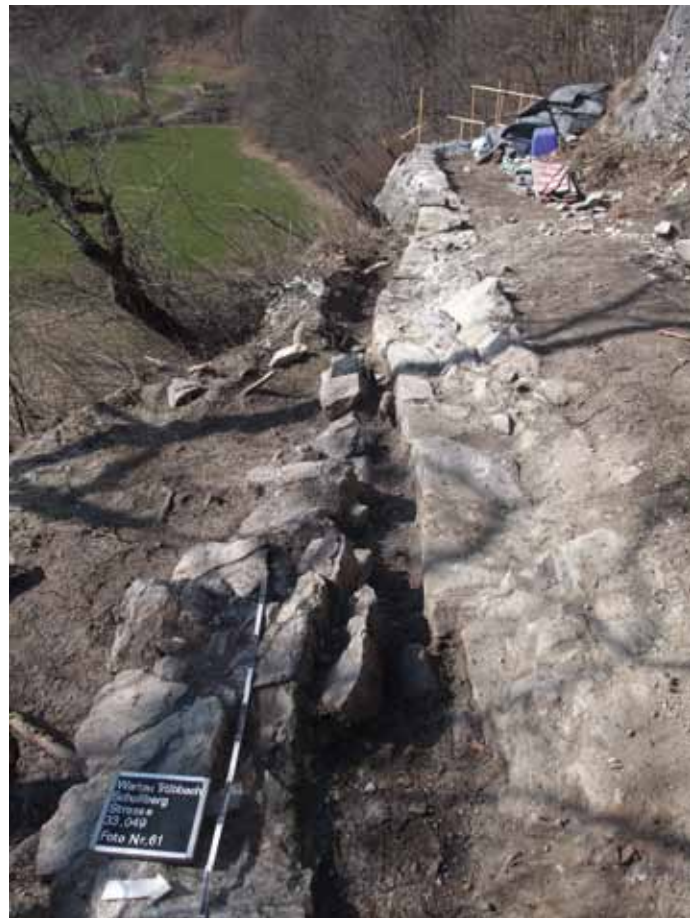
Die Fundamente zweier Brüstungsmauern bezeugen eine Verbreiterung der Strasse am oberen Ausgang der Hohwand.