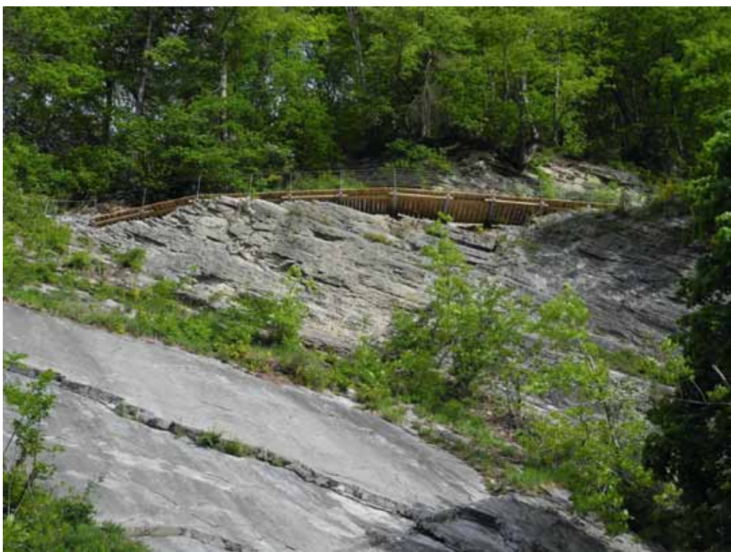
Der neue Steg scheint über dem alten Steinbruch zu schweben.

Jetzt gibt es ein neues Wandererlebnis zwischen Sargans und Trübbach und ein neues Band zwischen Sarganserland und Werdenberg: Wie von einem Balkon überschaut man von der hohen Stützmauer der alten Strasse die Sarganser Au und blickt hinüber zum Pizol, gegen Bad Ragaz und in die Bündner Herrschaft. Steil geht es dann aufwärts zum Scheitelpunkt, wo auf einer ehemaligen Ausweichstelle ein Picknickplatz aufgeschüttet wurde. Auf dem schwebenden Stahlsteg überquert man dann bequem die Steilwand eines früheren Steinbruchs. Dann kann man in einen lauschigen Waldweg eintauchen, der von Bunkern der einstigen Festung Schollberg gesäumt wird. Tief unten liegen Kantonsstrasse, Eisenbahn und Autobahn, Rhein und Saarkanal, Wiesen und Felder.