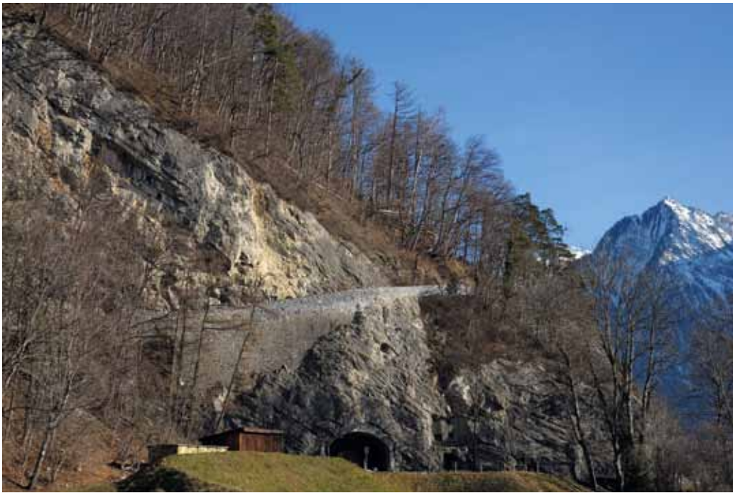
Die Alte Schollbergstrasse in der Hohwand nach der Wiederherstellung.

Ausbau mit der Klausel, dass Orte, die allenfalls nicht mitmachen, künftig nur den bisherigen Zollertrag erhalten sollten, aber an den erwarteten Mehreinnahmen nicht beteiligt wären.