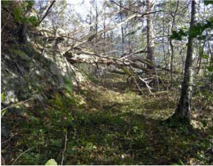
Ein typisches Bild der Schollbergstrasse vor der Wiederherstellung.