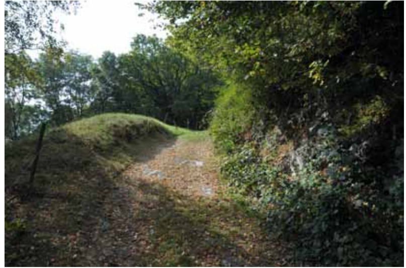
Die Alte Schollbergstrasse bei Obertrübbach.