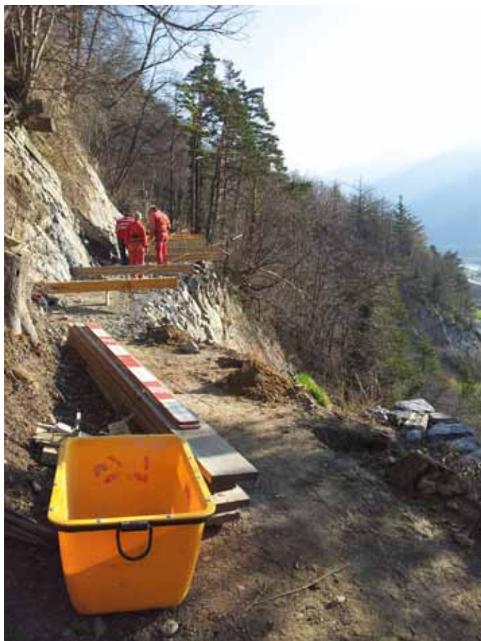
Vorbereitungsarbeiten für den Einbau des Steges im Vorderen Steinbruch.