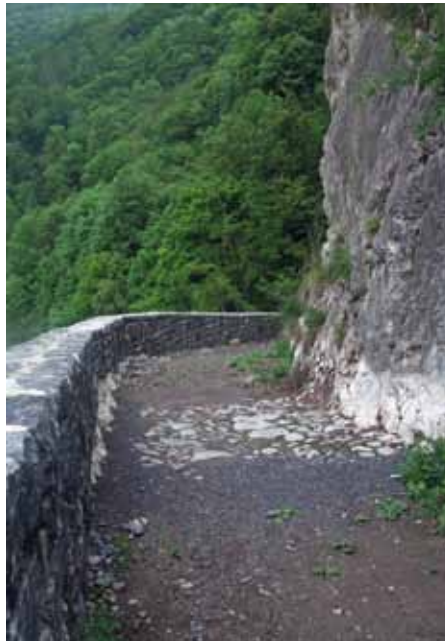
Die Strasse am Ausgang der Hohwand mit dem archäologischen Fenster.