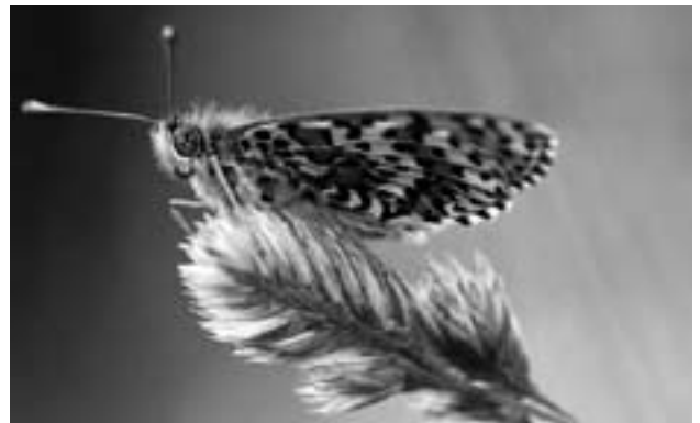
Der Rote Scheckenfalter lebt in trockenen Magerwiesen und -weiden, fliegt teils aber auch im neuen Bürgerwingert.