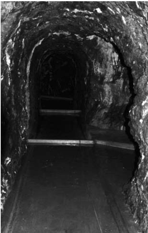
Der Rückstau von Wasser im früheren Militärstollen erhöht die Luftfeuchtigkeit für die Fledermäuse.