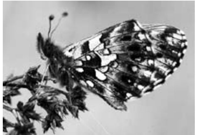
Der Hainveilchen-Perlmutterfalter besiedelt magere, trockene Wiesen und Weiden. Laut Roter Liste ist er stark gefährdet.

abgesunken sind, sind die meisten Wartauer Giessen versiegt. In einem weiteren Projekt will man nun die trockenen Giessen zu neuem Leben erwecken. Ablagerungen wurden bereits entfernt, die Ufergehölze werden verjüngt, und momentan wird die künftige Bewässerung von über zwei Kilometern Giessen aus dem Saarkanal projektiert. Die Gemeinde Wartau ist sich ihrer Naturschätze bewusst und trägt ihnen Sorge. Aufwertungsprojekte wie am Burghügel oder an den Giessen tragen ebenso dazu bei wie die momentan laufende Katalogisierung von Trockenmauern im gesamten Gemeindegebiet. Alle Naturschätze zu erhalten, auch unter wachsendem Siedlungsdruck und bei Strukturveränderungen in der Landwirtschaft, wird wohl eine stete Herausforderung bleiben.