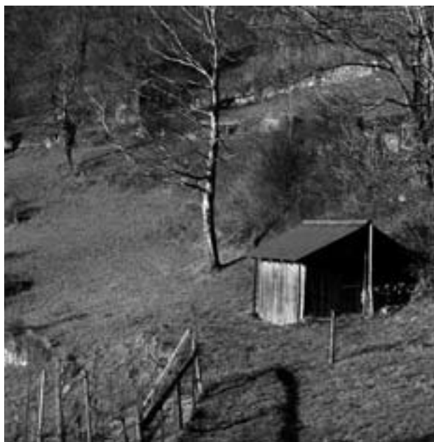
Mosaik von Wiesen, Reben, Mauern und Gehölzen.