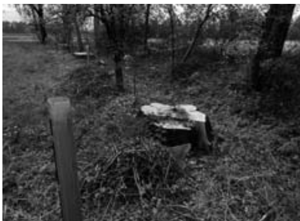
Die Wurzelstöcke und der Jungbaumschutz zeugen von der Verjüngung der Baumhecke.