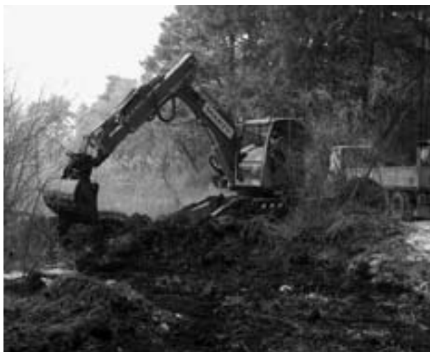
Die Baggerarbeiten profitierten vom gefrorenen Boden im kalten Januar 2009.

Die künftige Bewässerung von gegen 2,3 km Giessen wurde im vergangenen Winter im Detail projektiert, so dass sie nun bei den zuständigen Behörden zur Bewilligung eingereicht werden kann. Es geht um zwei Giessen im Raum Schwetti und drei Giessen im Raum Alberwald. Die bauliche Umsetzung der beiden Bewässerungen ist als Etappe 3 und 4 vorgesehen und wird die Giessen wieder zu Fliessgewässern machen.