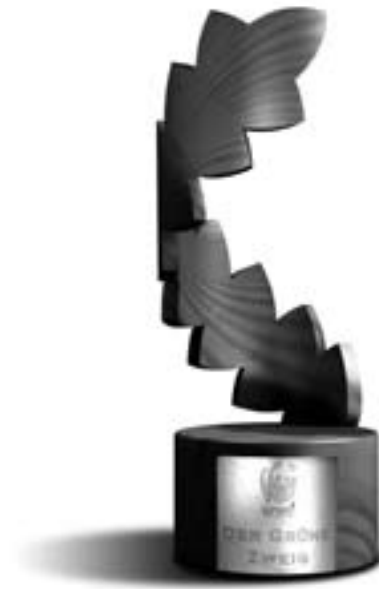
«DerGrüneZweig»: Auszeichnung für die kleinen Schritte zu Gunsten der Umwelt

des Projektes. Zudem sollte das Projekt kurz vor der Umsetzung stehen oder bereits ausgeführt sein. Die Bewerbungsunterlagen können auch stellvertretend von Drittpersonen ausgefüllt und eingereicht werden.