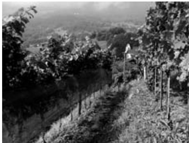
Die Trauben reifen, die Schutznetze werden montiert (hinten: Kirche Gretschins).

Im Bürgerwingert sorgen blumenreiche Terrassenböschungen, Steinlinsen, Buschgruppen und unbestockte Randflächen für Lebensraum von Reptilien, Tagfaltern, Laufkäfern und weiteren Tieren. Ein weiteres Element sind die Trockenmauern, welche das steile Gelände stützen und heute am Burghügel auch in Wiesen- und Waldflächen an den früheren Rebbau erinnern. Die offenen Fugen der Trockenmauern bilden Lebensraum für zahlreiche angepasste Tiere. So können sich im Spaltensystem Schlingnattern verkriechen, Töpferwespen und Seidenbienen haben hier einen Nistplatz, Spitzmäuse finden Unterschlupf, und für Amphibien und Laufkäfer dienen die Trockenmauern als geschützte Winterquartiere. Die prägende Funktion der Mauern für das Landschaftsbild macht sie zusätzlich erhaltenswert. Im Rahmen des Burghügel-Projekts wurden über 400 Laufmeter bzw. rund 730 Quadratmeter Trockenmauern inner- und ausserhalb des Bürgerwingerts neu aufgebaut oder instand gestellt. Neben den offenen Fugen achtete man auch bei der Hinterfüllung auf eine kleintierfreundliche Bauweise. Die verwendeten Schroppen, d.h. grobe Steine, halten die Mauer nicht nur trocken und schützen sie vor Frost-