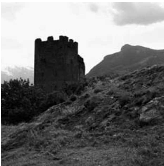
Rund um die Ruine sorgen Felsrippen für trockenen Lebensraum. Hinten die markante Nase des Gonzens.

passt aber auch ausgezeichnet zu Spargelgerichten und damit zu einer Wartauer Spezialität. Zum Konzept des Bürgerwingerts gehören weiter eine durchgehende Terrassierung und die starke Gewichtung ökologischer Kriterien. So wurden die neuen Terrassenböschungen mit Blumenwiesen-Saatgut angesät. Zur Schonung der Tierwelt und gegen die Verlärmung der Landschaft werden die Böschungen mit der Handsense gemäht. Als Lebensraum für Tiere wurden mehrere Steinlinsen gebaut und einige Randflächen nicht bestockt. Die Bewirtschaftung erfolgt nach Richtlinien, welche leicht strenger als jene von IP-Vitiswiss sind. Im Jahre 2004 wurde der neue Bürgerwingert angelegt und gepflanzt. Mit einer Erweiterung von 2007 misst er heute samt den unproduktiven Flächen 59 Aren. Rund 20 Rebleute arbeiten im Jahresablauf für den guten Tropfen, fachsimpeln über den Weinbau und helfen einander mit Rat und Tat. Sie werden unterstützt von einem Rebmeister, welcher die nötigen Arbeiten anweist und zentral die Spritz- und Mulcharbeiten erledigt. Die ersten Trauben für die Kelterung wurden im Herbst 2006 abgelesen und ergaben einen qualitativ vielversprechenden Vorgeschmack auf den künftigen Vollertrag. Die Unbill der Witterung an den jungen Stöcken machte auch den Jahrgang 2007 zu einem raren Tropfen. Doch die Ernte