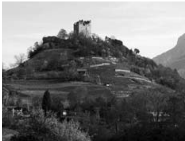
Der Burghügel mit der Burgruine.

Dabei birgt diese Landschaft ein grosses Potenzial für eine ausserordentliche Vielfalt an wärmebedürftigen Pflanzen und Tieren. Der Boden ist oft flachgründig, stellenweise kommen die Felsrippen bis zur Erdoberfläche. Die Exposition nach Süden wird in ihrer Wirkung unterstützt durch den häufigen Föhn, welcher den Wartauer Hügeln nicht nur kräftigen Wind, sondern auch besonderen Wärmegenuss beschert. Dies begünstigt das Vorkommen von wärmeliebenden Arten, die man weiter nördlich vergebens sucht. Fast alle wärme- und trockenheitsliebenden Pflanzenarten des Churer Beckens gelangen in ihrer Verbreitung gerade noch bis Wartau, nur wenige bis Buchs (Seitter 1982). Im schweizerischen Inventar der Trockenwiesen und -weiden finden sich so in der Wartauer Hügellandschaft