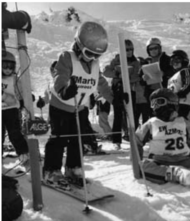
J0-Rennen 2009 Pizol-Pardiel