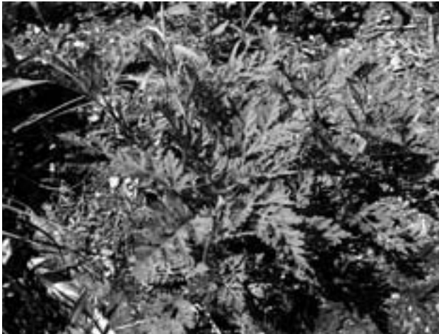
Aufrechtes Traubenkraut ( Ambrosia artemisiifolia )