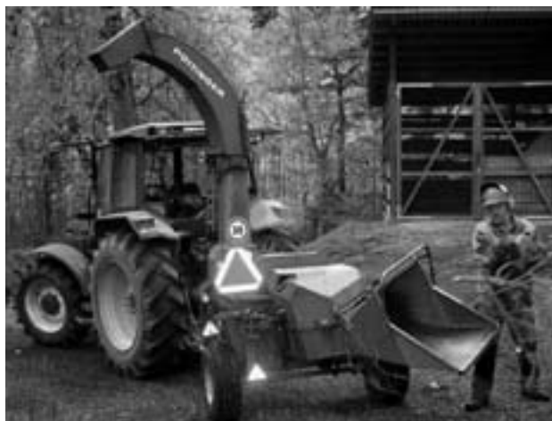
Der Zapfwellenhacker kann Astmaterial bis zu einem Durchmesser von 25 cm verarbeiten.

Besten Dank für das Verständnis und die Bemühungen zu Gunsten einer sauberen Umwelt.