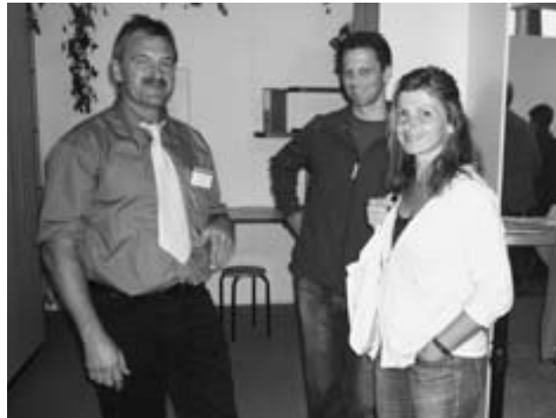
Blaues Hemd, gelbe Kravatte: Das Wartauer Gewerbe möchte auch dieses Jahr in ihren unverkennbaren Tenus ein Farbtupfer an der WIGA sein.

Die Aussteller freuen sich, wenn sie möglichst viele Wartauer an der WIGA 2009 begrüßen dürfen. Ein Höhepunkt aus Wartauer Sicht ist der «Wartauer-Abend» am Mittwoch, 9. September 2009. An diesem Tag findet beim Gemeinschaftsstand ein Apéro statt, anschliessend wird im Festzelt ein kleines Programm organisiert, bei dem unter anderem die Gewinner des Wettbewerbs verlost werden.