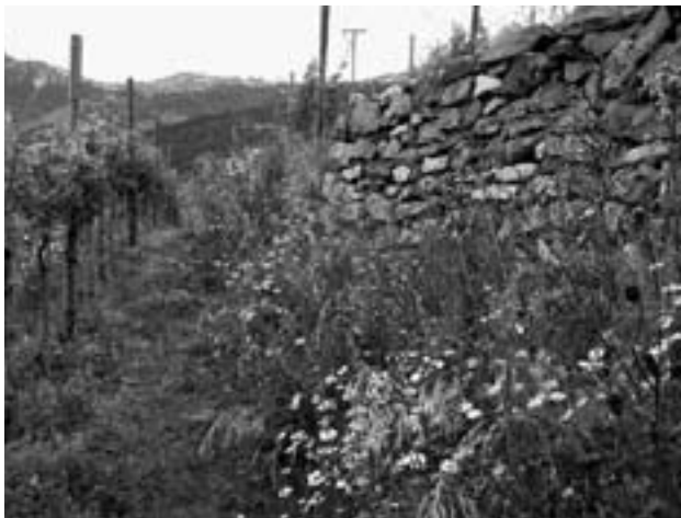
Dank Blumenwiesen und Trockenmauern ist der Bürgerwingert auch ein wertvoller Lebensraum.

2008 zeigte eine deutliche Steigerung, und so dürfte der «Wartauer AOC Bürgerwingert» bald an Bekanntheit gewinnen. Die Politische Gemeinde und die Reblente teilen sich den Flaschenertrag; der nicht selbst beanspruchte Teil geht in den Verkauf (Bezug: Weinkellerei Gonzen, Sargans).