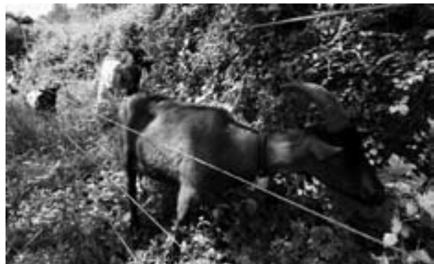
Die Gämsfarbige Gebirgsziege frisst Brombeerblätter, im Hintergrund knabbert eine Walliser Schwarzhalbziege an Waldreben.

Wartau ist eine Gemeinde mit besonderem Reichtum an Naturschätzen. Neben den bereits erwähnten Trockenwiesen und -weiden tragen auch verschiedene Flachmoore und die Höhenlage von 464 m ü. M. (Rheinebene) bis 2343 m ü. M. (Alvier) dazu bei. Seitter (1982) vermutet Wartau als eine der pflanzenreichsten, wenn nicht als die pflanzenreichste Gemeinde in den Kantonen St.Gallen und Appenzell. Von besonderer landschaftlicher Schönheit ist die Wartauer Rheinebene: Scheinbar willkürlich schlängeln sich hier die geschwungenen Linien des Mühlbachs und mehrerer Giessen durch das rechteckige Muster von Wiesen, Äckern und Wegen. Giessen sind vom Grundwasser gespeiste Bachläufe, die in der Ebene entspringen. Doch seitdem die Rheinsohle und der Grundwasserspiegel