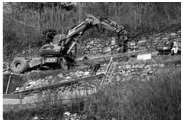
Sanierung einer Trockenmauer im steilen Gelände.