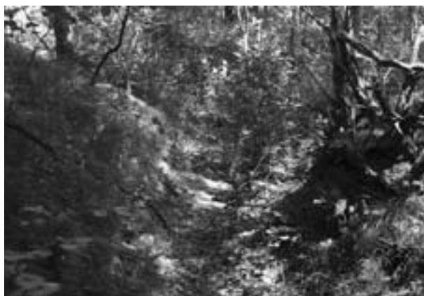
Trockener Giessen mit dem beidseitigen Ufergehölz.

Erste Ergebnisse werden voraussichtlich bereits im nächsten Winterhalbjahr erkennbar, wenn die Ablagerungen entfernt werden. Gleichzeitig beginnt am Mühlbach der erste Teil der forstlichen Massnahmen. Die eigentlichen Bewässerungen werden anhand des Vorprojekts noch im Detail geplant, worauf dann die nötigen Bewilligungen eingeholt werden können. Nach provisorischem Zeitplan dauert es etwa bis 2012, bis beide Bewässerungsprojekte umgesetzt sind. Man kann sich schon heute auf das fliessende Wasser in den bisher trockenen Giessen freuen.