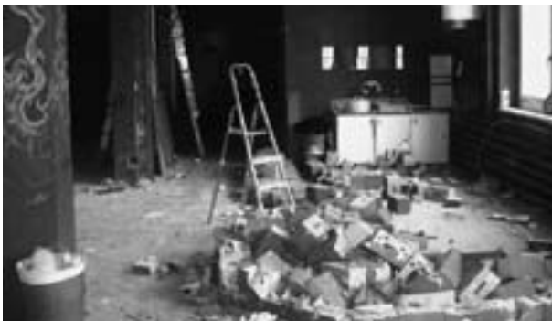
Abschied nehmen vom Chillout

Der Billardtisch fand seinen Platz im Raum. Ebenso der Tischfussballkasten. Es fehlt noch die Installation der Bar, die dann gemeinsam mit den Sofas für Gemütlichkeit sorgen wird.