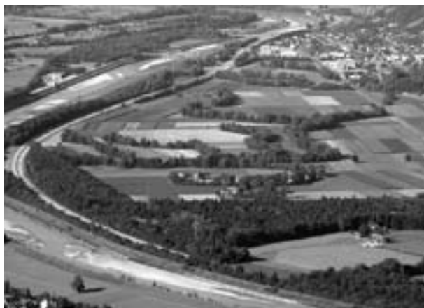
Die geschwungenen Giessen geben der Landschaft ihren besonderen Reiz.

Als erste Massnahme werden die trockenen Gerinne von Ablagerungen befreit, um die ursprüngliche Form der Giessen wiederherzustellen. Weiter werden die Ufergehölze entlang des ganzen Giessenetzes verjüngt, um faule oder dürre Bäume aus Sicherheitsgründen zu entfernen und mit angepassten Arten zu ergänzen. Als zweite Massnahme wird bei der bestehenden Wasserentnahme am Saarkanal zusätzliches Wasser entnommen, um damit im Raum «Schwetti» zwei Giessen mit einer Länge von 920 Metern zu bewässern. Als dritte Massnahme schliesslich wird das zusätzliche Wasser aus dem Mühlbach in den Raum «Alberwald» überführt, wo es drei weitere Giessen mit einer Länge von 1370 Metern bewässert.